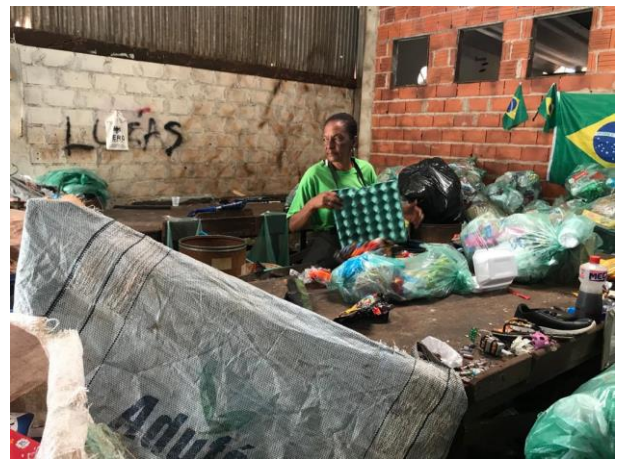
(Realização da separação dos resíduos)