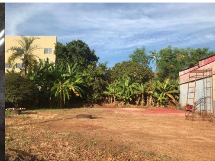
(Imagens do galpão a ser locado para o centro de triagem)