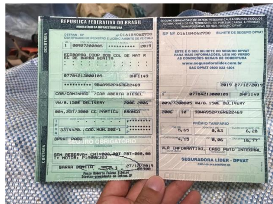
(CRLV do caminhão)