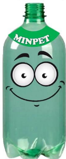
Coleta de garrafas pet