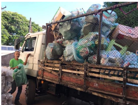
(Caminhão para coleta seletiva)

Sempre prezamos o bom funcionamento de atividades que beneficiem os catadores, sendo que nossa bandeira é a defesa dessa classe tão batalhadora, portanto entendemos que é de suma importância considerar todo trabalho em grupo já desenvolvido no município, para isso realizamos parceria com uma antiga entidade que atua no ramo de recicláveis há anos na cidade de Barra Bonita, denominada ECOBARRA, que possui um quadro de cooperados experientes no assunto, os quais serão ferramentas fundamentais para a excelência nos resultados finais. Nossa parceria otimizará as relações entre a coleta seletiva e a adesão da comunidade ao projeto, uma vez que costumeiramente, uma boa parte da população, já armazenavam recicláveis para esse grupo, ficando ao nosso encargo, multiplicar a ideia, disseminando para toda a população a oportunidade de colaborar gradativamente com o projeto. Para tanto, foi estimado a utilização do caminhão, prensa enfardadeira e transpaleteira, pertencentes a essa entidade, juntamente à infraestrutura necessária para execução deste objeto.